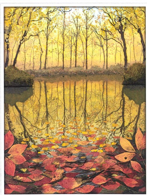
前回の創造展大賞・文部科学大臣賞受賞作品