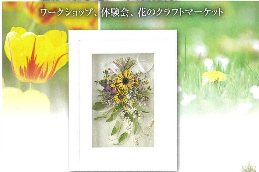
前回のレカンフラワーコンテスト最優秀作品